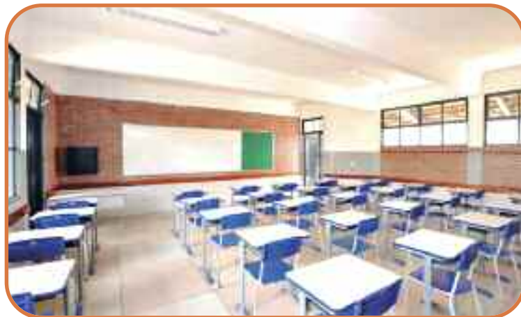
Mais horas e mais resultados, as escolas integrais impulsionam Goiás ao topo do ranking nacional

Desigualdades e impactos da pandemia ainda exigem atenção e investimentos estratégicos