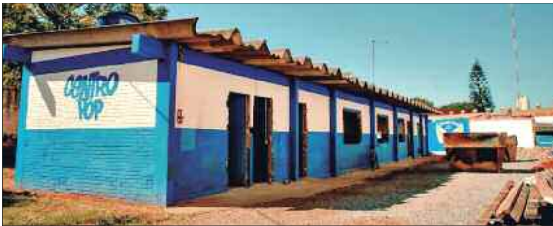
Centro Pop, em Anápolis, é objeto de discussão na Câmara Municipal