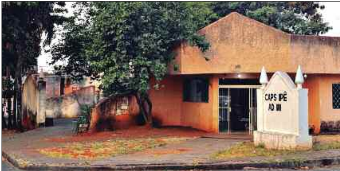
Lucas de Godoi

CAPs da rede municipal de Goiânia estão entre as poucas unidades próprias contempladas com emendas parlamentares