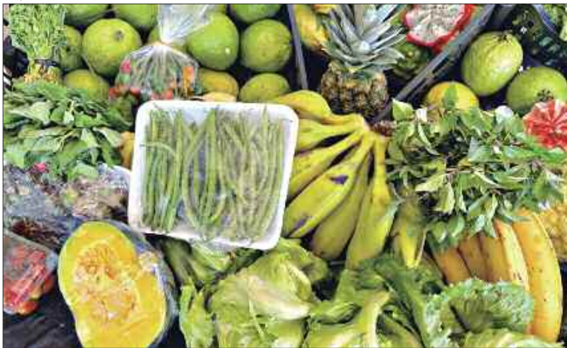
Programa de Aquisição de Alimentos: Goiás é laboratório de políticas públicas

segurança pública, os homicídios dolosos caíram 11,35%, de 1.004 para 890 vítimas — a maior redução percentual do Centro-Oeste, conforme o Mapa da Segurança Pública 2025 do Ministério da Justiça, baseado em dados do Sinesp, provando que os esforços contra a pobreza, a fome e o desemprego surtem resultados rápidos.