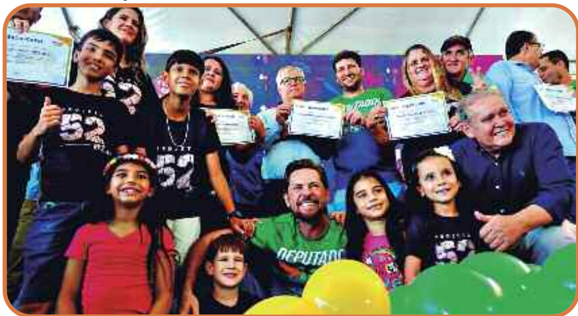
Edição do programa Deputados Aqui em Itapuranga: logística robusta

O valor de R$40 mil destina-se, em grande parte, à montagem de uma estrutura que transforma a praça pública dos municípios visitados pelo programa em um palco para os parla-