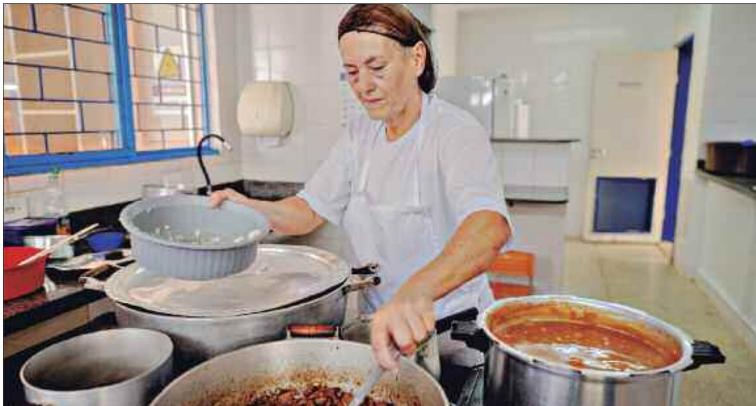
Workshop com foco em contratação de profissionais operacionais

Entre as atividades previstas, destaca-se o workshop "Qualidade no Atendimento", que será realizado na próxima terça-feira (21), em parceria com o grupo Ânima. O encontro acontece no Centro de Formação Profissional (Cenfor), localizado na Avenida do Estado, quadra 40, no bairro Recanto do Sol. Com início às 9h, a programação inclui uma apresentação institucional da empresa, seguida do treinamento e, ao final, entrevistas presen-