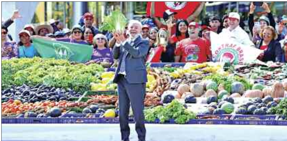
Em 2003, o presidente Luiz Inácio Lula da Silva fez da erradicação da fome prioridade nacional com o Fome Zero

O Programa das Nações Unidas para o Desenvolvimento (PNUD) destaca o impacto da marginalização e a relação entre pobreza e conflitos armados