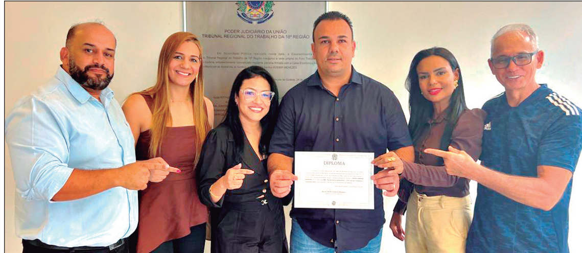
Sessão do TRE contou com representantes de partidos, do MP e da OAB