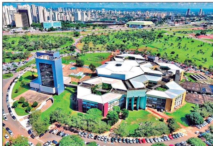
Goiânia estima receita de R$ 10,4 bilhões

servadora de arrecadação, com crítica de vereadores que apontaram para tentativa de diminuir o repasse constitucional do duodécimo para a Casa e o montante das emendas parlamentares, calculados a partir de um orçamento mais enxuto.