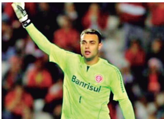
Goias sem dinheiro para os compromissos de final de ano

O Goiás apostou no acesso e não poupou gastos durante os últimos dois anos. A conta ainda estava fechando por conta da antecipação de 10% junto aos investidores que adquiriram os direitos comerciais da Liga Forte de futebol. O