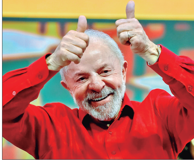
Promessa de campanha de Lula, isenção deve reduzir repasses a municípios

Levantamento do TCM-GO indica que metade das prefeituras vão perder um quarto da receita proveniente do imposto de renda retido na fonte