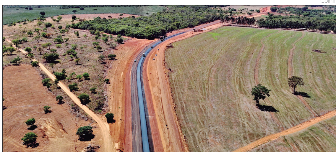
Na GO-219, estão em execução 31,9 quilômetros de pavimentação

Enquanto isso, a Agência Goiana de Infraestrutura e Transportes (Goinfra) avança em outra frente de obras: a aplicação da capa asfáltica na GO-219, entre Hidrolândia e Bela Vista de Goiás. A expectativa é liberar o tráfego em um terço do trecho até o final do ano. A pavimentação da via faz parte de um pacote de investimentos que supera R$ 250 milhões, somando recur-