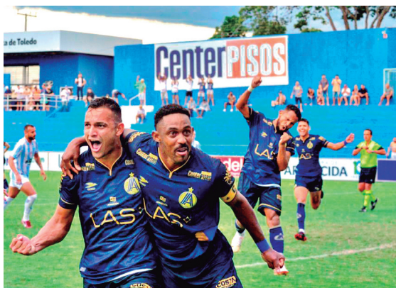
Campeã brasileira da Série D, Aparecidense pode encerrar atividades