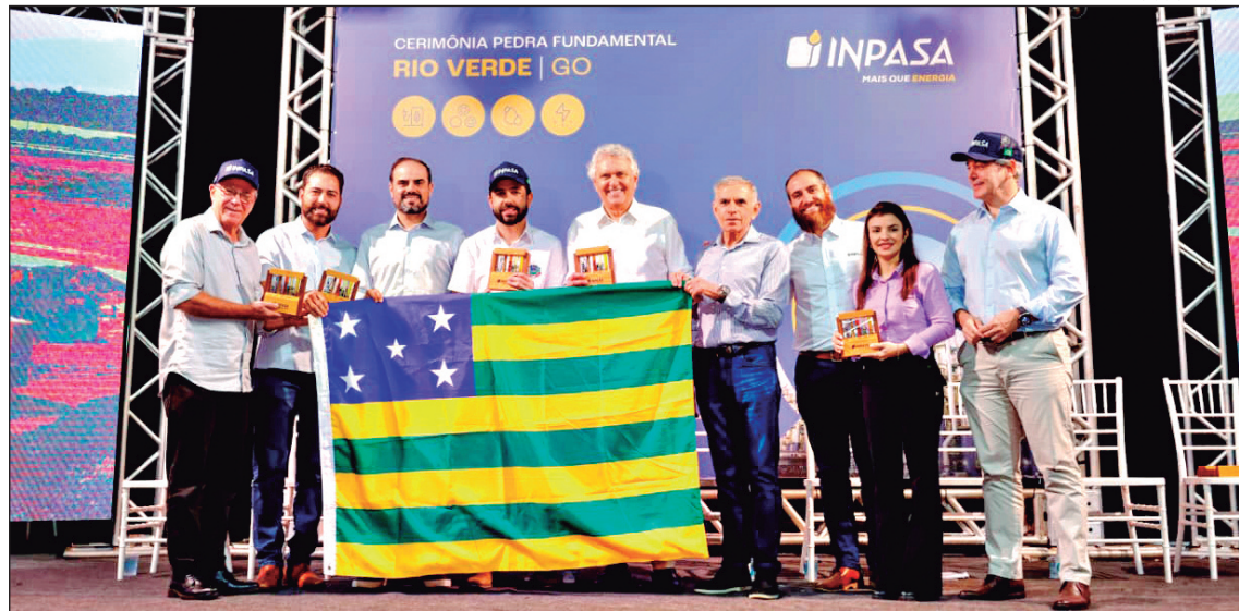
Ronaldo Caiado participa do lançamento da pedra fundamental da nova unidade da Inpasa, em Rio Verde

Com investimento de R$ 2,4 bilhões, unidade da Inpasa deve gerar 2,7 mil empregos e consolidar Goiás como polo de produção de biocombustíveis e energia limpa