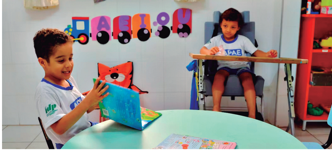
Crianças atendidas em unidade da APAE: impacto da medida extrapola a esfera educacional

Governo Federal direciona matrículas para a rede regular, ameaçando o modelo de escolas especializadas e levantando debates sobre o direito de escolha das famílias e o suporte a estudantes com demandas intensivas