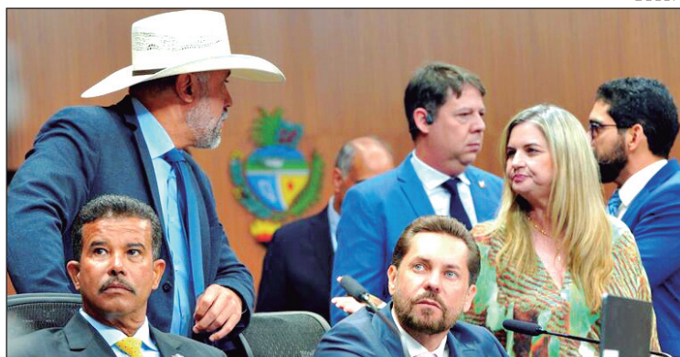
Deputados aprovaram parecer por diligência à Secretaria de Economia para análise técnica

A proposta determina ainda que o relatório seja encaminhado ao Tribunal de Contas do