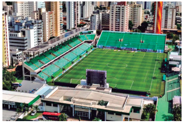
Serrinha inacabada. Sinal de que nada avançou no Goiás

De acordo com o novo Estatuto, a gestão cotidiana da agremiação ficaria a cargo da Diretoria Executiva, composta por até cinco membros, sendo um diretor de futebol, um diretor administrativo, financeiro e de operações, um diretor de patrimônio, marketing e novos negócios e um diretor de esporte olímpicos, paralímpicos, iniciação esportiva e social. Todos respondendo diretamente ao diretor Executivo (CEO). Tudo muito bonito, mas não funcionou.