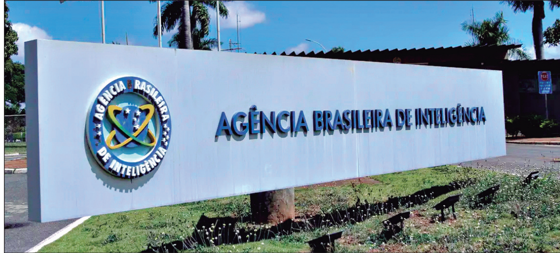
Abin: segurança nas eleições e ataques com IA são desafios para 2026

Abin divulga documento antecipando ameaças, especialmente com IA; velocidade de disseminação preocupa advogado eleitoralista