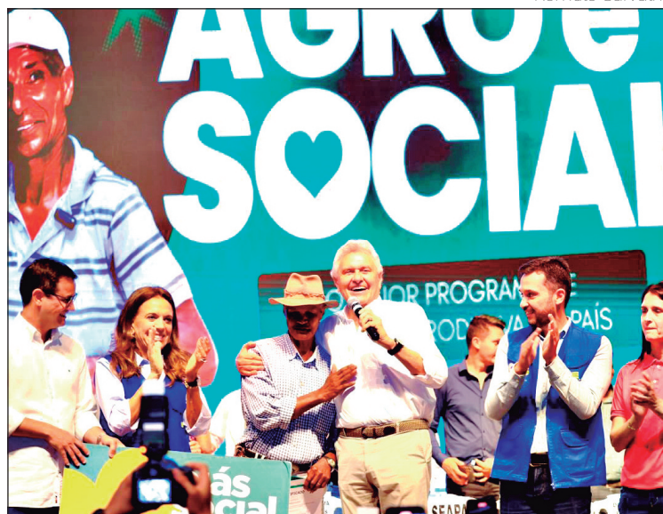
Caiado e Gracinha encerram edição do Agro é Social em Anápolis na sexta-feira

A primeira-dama Gracinha Caiado ressaltou o impacto social do programa e os resultados alcançados. "O Agro Social traz um impacto muito grande para as famílias. Ele oferece qualificação, oportunidade e ferramentas para