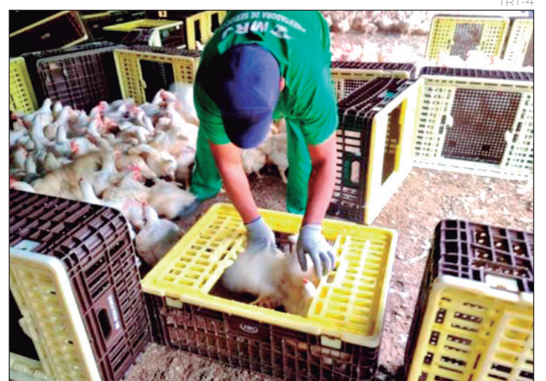
Justiça do Trabalho determina inclusão na JBS Aves na lista suja do Ministério do Trabalho

A ordem judicial ocorreu após Marinho ter avocado (chamado para a sua competência) processos administrativos já concluídos pela fiscalização, impedindo a publicação dos nomes das empresas no cadastro. O movimento foi classifica-