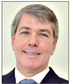
André Rocha, presidente da Federação das Indústrias do Estado de Goiás (Fieg)

Para 2026, seguimos com um horizonte de oportunidades: expansão da presença no interior, consolidação de novas unidades, fortalecimento da marca educacional e ampliação da agenda de inovação e tecnologia. Continuaremos atuando com responsabilidade, eficiência e propósito, transformando vidas por meio da educação, da saúde, da inovação e do trabalho — pilares que sustentam um Sistema Indústria cada vez mais forte e conectado às necessidades de Goiás.