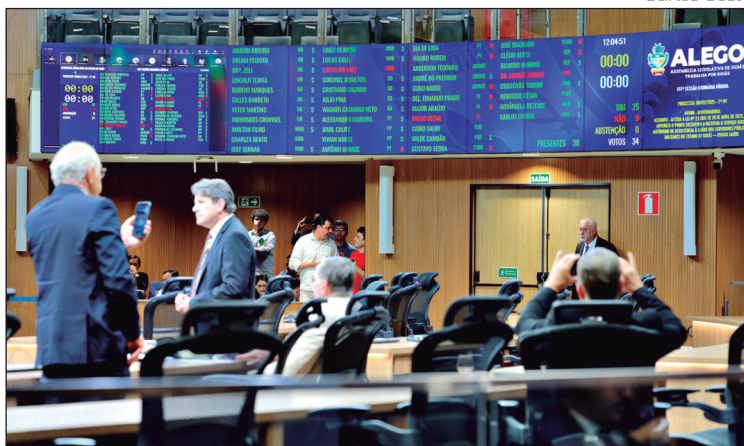
Parlamento durante votação da nova cobrança no Ipasgo Saúde