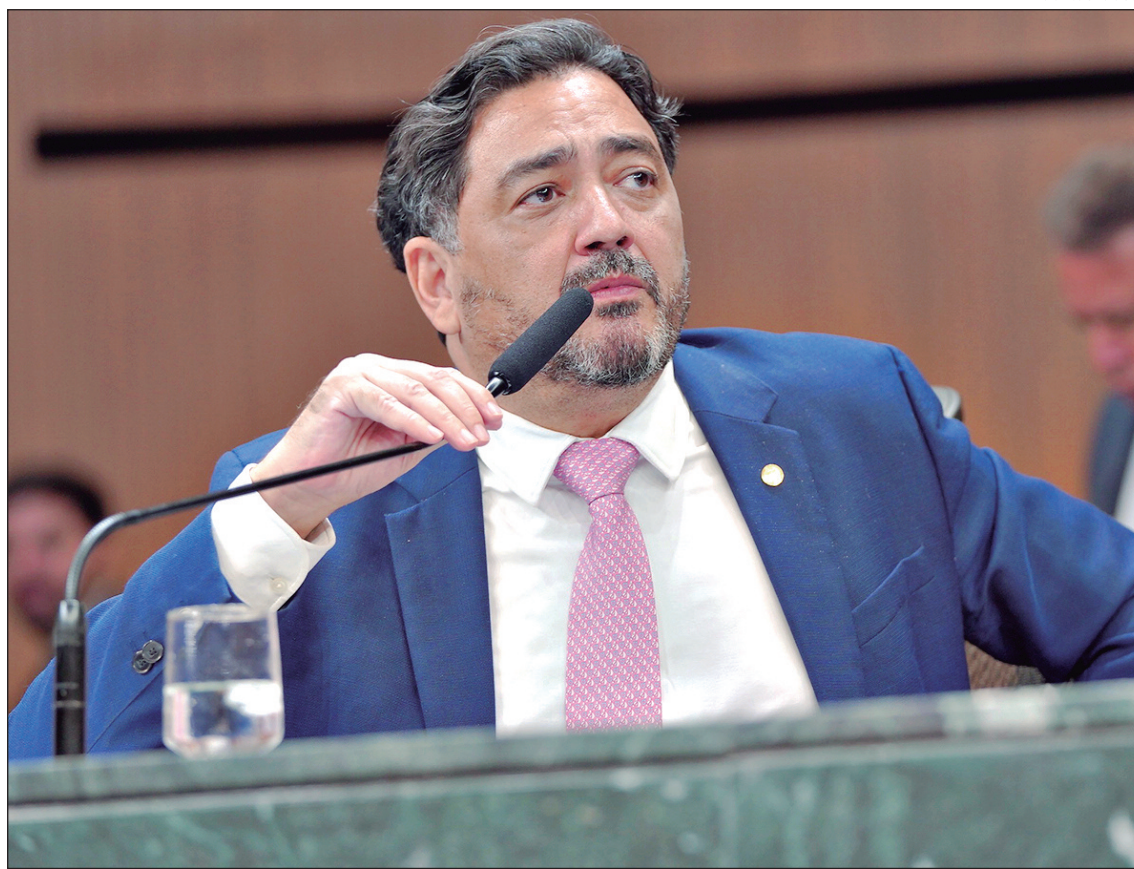
Deputado Talles Barreto, líder do governo na Alego, durante agenda na Assembleia Legislativa