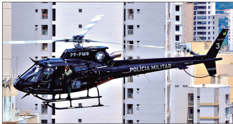
Polícia Militar de Goiás recebeu investimentos para contratação de efetivo, reformas de unidades e aquisição de armamento

As maiores taxas estão em estados da região Nordeste: Ceará (32,6), Pernambuco (31,6) e Alagoas (29,4). Já as menores foram registradas em São Paulo (5,44), Santa Catarina (6,38), Distrito Federal (8,88) e Rio Grande do Sul (10,59). Os dados são enviados pelas secretarias