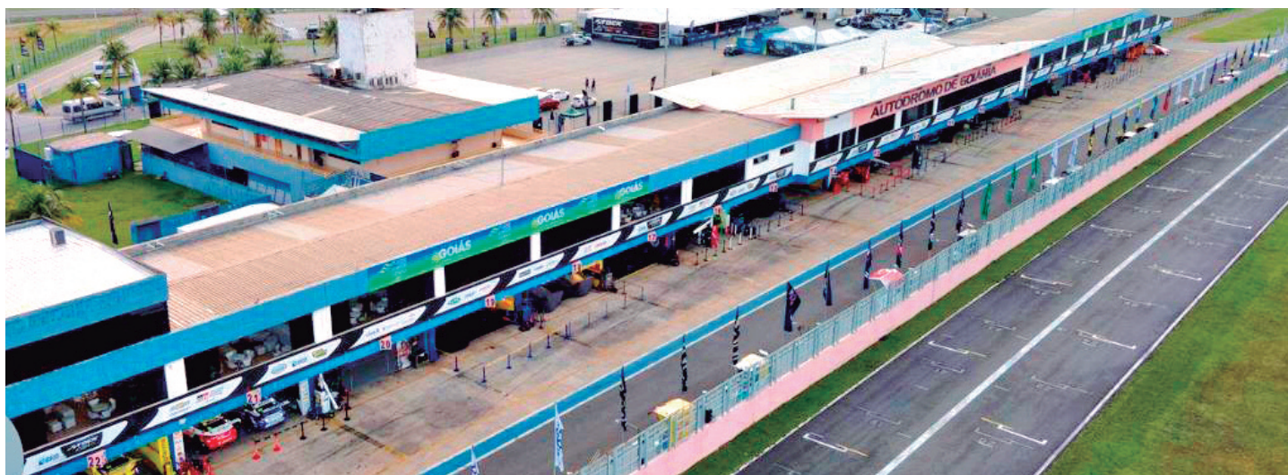
Autódromo Internacional de Goiânia, reformado pelo Governo de Goiás

A dois meses da etapa mundial da MotoGP em Goiânia, a rede hoteleira já registra 65% de ocupação, e deverá chegar a 100% no mês de março. Só a organização do evento solicitou a reserva de 2 mil apartamentos. Tudo isso vai movimentar o turismo e a economia do Estado. Nenhum outro evento, nem mesmo o futebol, é capaz de promover tanto o Estado e, logicamente, suas autoridades, principalmente o Governador Ronaldo Caiado. Não que a reforma não devesse ser realizada e que a MotoGP não viesse para Goiânia. Foi uma iniciativa arrojada e muito importante para o Estado de Goiás. O que se questiona, é porque o mesmo tratamento não foi dado ao estádio Serra Dourada.