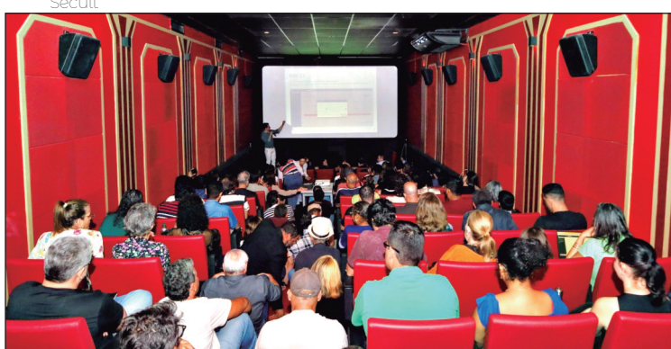
Governo de Goiás lança versão atualizada do Baru 2.0, sistema de gestão de editais para projetos culturais