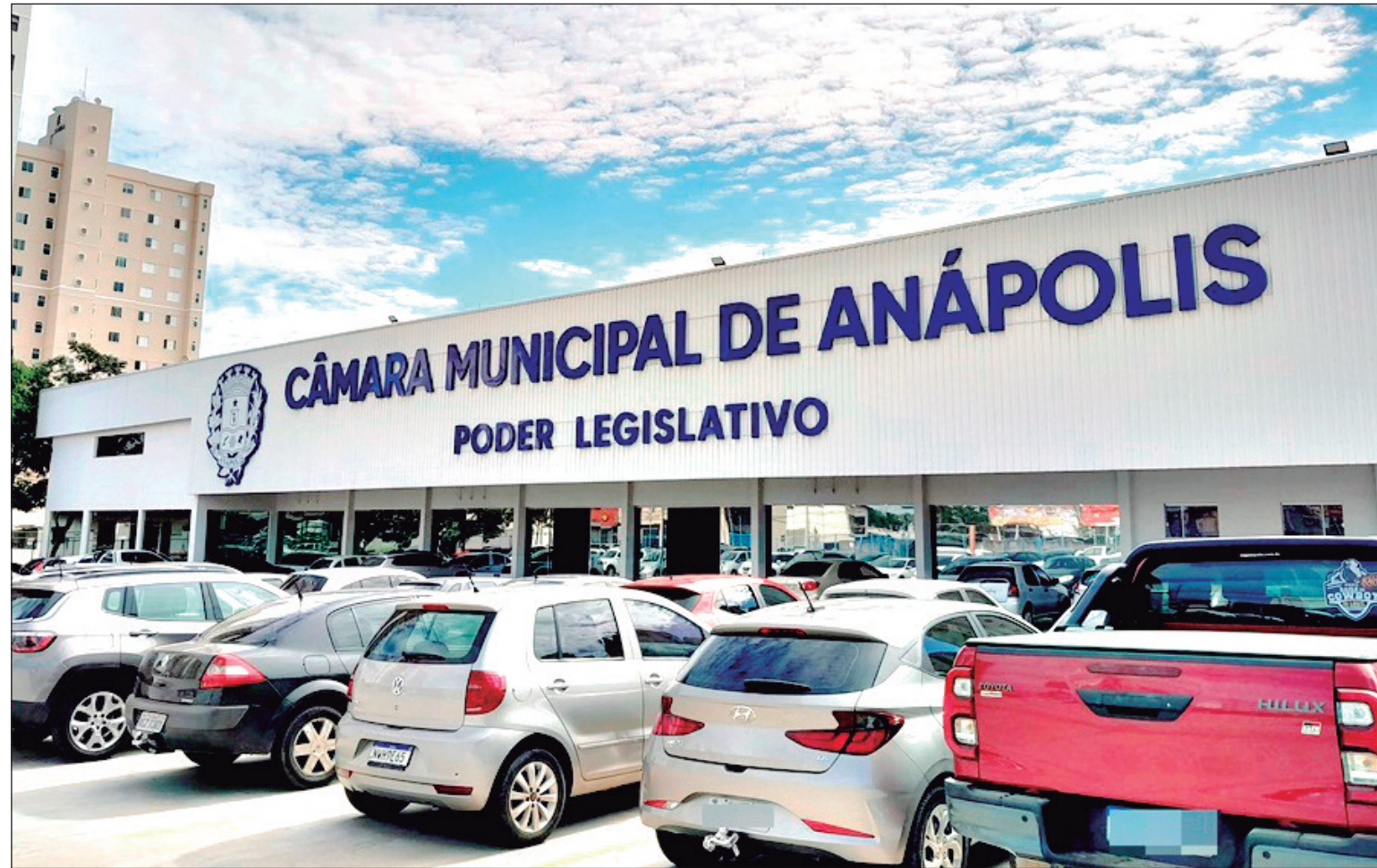
Câmara Municipal de Anápolis