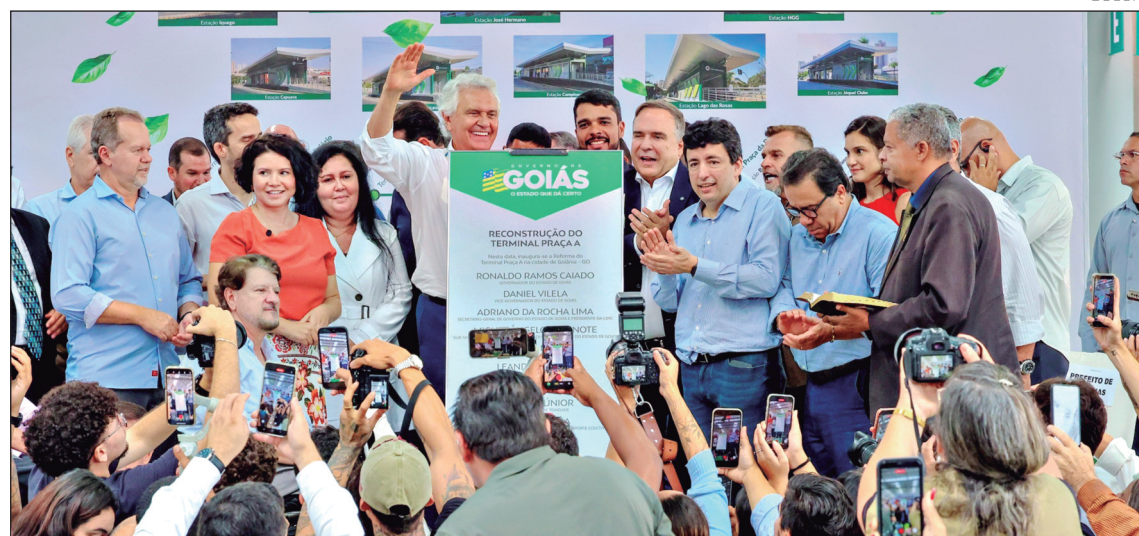
Governador Ronaldo Caiado entrega terminal Praça A, novos ônibus e estação de recarga: transporte coletivo renovado e sustentável

As novidades integram o Projeto Nova RMTc, que investe R$ 2 bilhões para melhorar a qualidade do serviço prestado aos cerca de 530 mil usuários diários de 19 municípios. Caiado lembrou que os avanços ocorrem sem nenhum custo adicional ao cidadão, já que a tarifa de R$ 4,30 não tem reajuste desde 2019. “É uma parceria que deu certo entre o Estado, as prefeituras e o empresariado. Esse foi o tripé que fez a frota mais verde do país. É a menor produção de CO2 em transporte público no Brasil. Somos