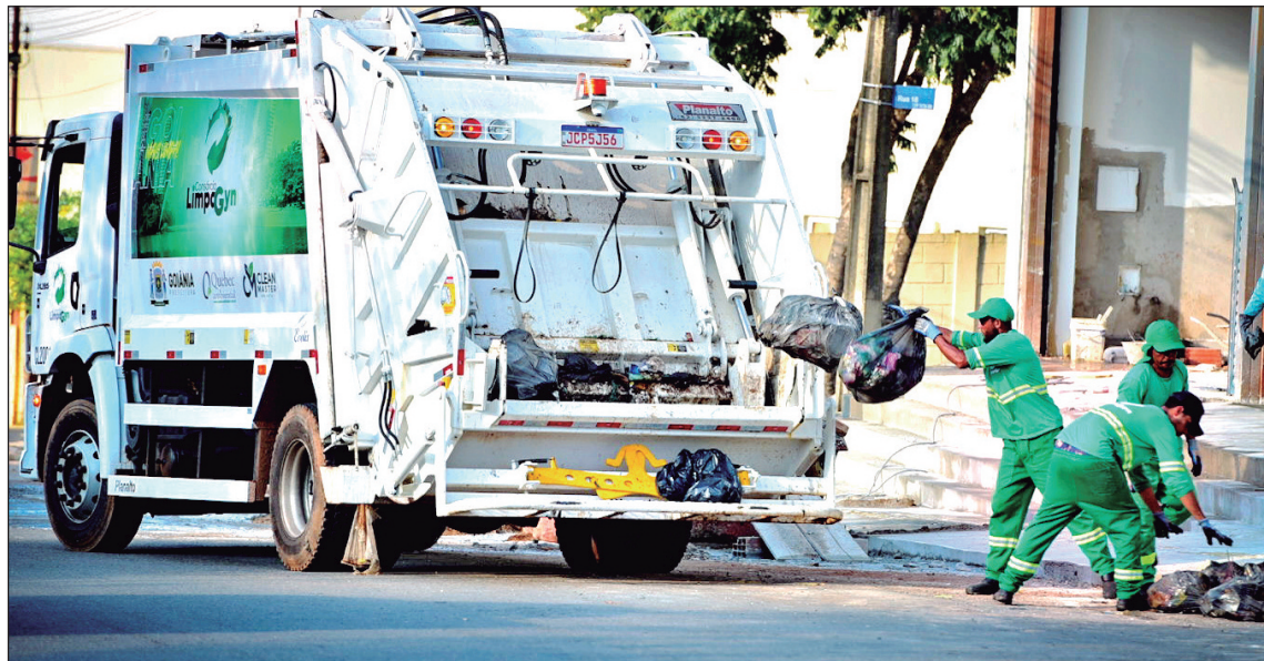
Concessionária é responsável pela coleta e outras demandas de zeladoria, como varrição mecanizada

Previstas em contrato, correções inflacionárias ampliam em R$ 66 milhões o custo da coleta de lixo e recicláveis, varrição mecanizada, remoção de entulho e “cata-treco”