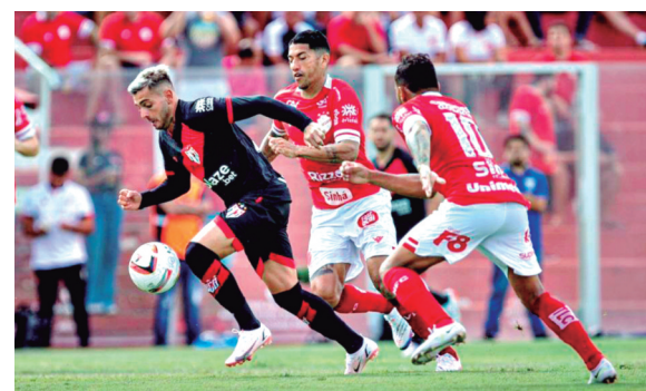
Agora é no OBA. Atlético tem ampla vantagem