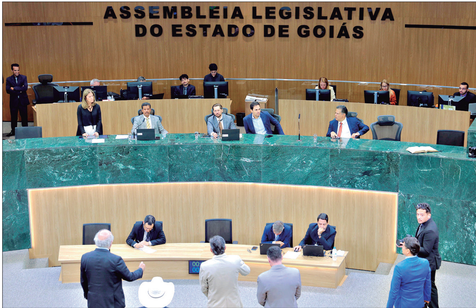
Sessão na Alego discute projeto que extingue a “Taxa do Agro”; deputados defendem celeridade e votação deve ocorrer na próxima semana

Matéria teve pedido de vista na Comissão Mista e expectativa é que votação ocorra na próxima semana