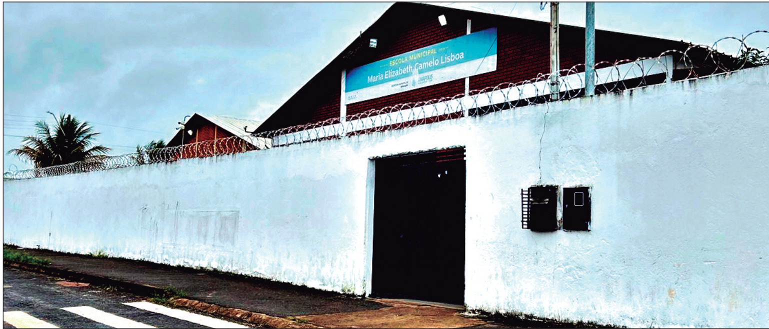
Escola Municipal Maria Elizabeth Camelo Lisboa, no Conjunto Filostro, em Anápolis

Pais denunciam ausência de docentes no 2º ano da Escola Maria Elizabeth Camelo Lisboa enquanto Prefeitura divulga entrega de kits e materiais na rede municipal