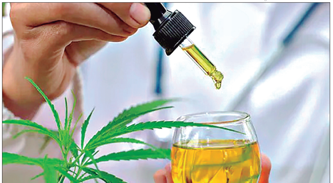
Anvisa regulamenta cultivo e produção de cannabis medicinal no Brasil

Desde 2015, ao menos R$ 377,7 milhões foram gastos com fornecimento público de produtos à base de cannabis e somente cinco estados ainda não têm leis de fornecimento público de cannabis medicinal. Além disso, oito