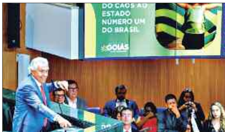
Caiado destaca a parceria entre o executivo e a Casa na aprovação de matérias

Caiado se despede do Executivo goiano no final de março. Em tom de encerramento, detalhou como a conduta ética foi capaz de transformar o perfil do Estado cuja dívida consolidada em 2019 era de R$ 6,4 bilhões. "Hoje não tem nada atrasado, não tem dívida a receber, é um estado redondo", afirmou ao mencionar que o diálogo com os demais Poderes foi