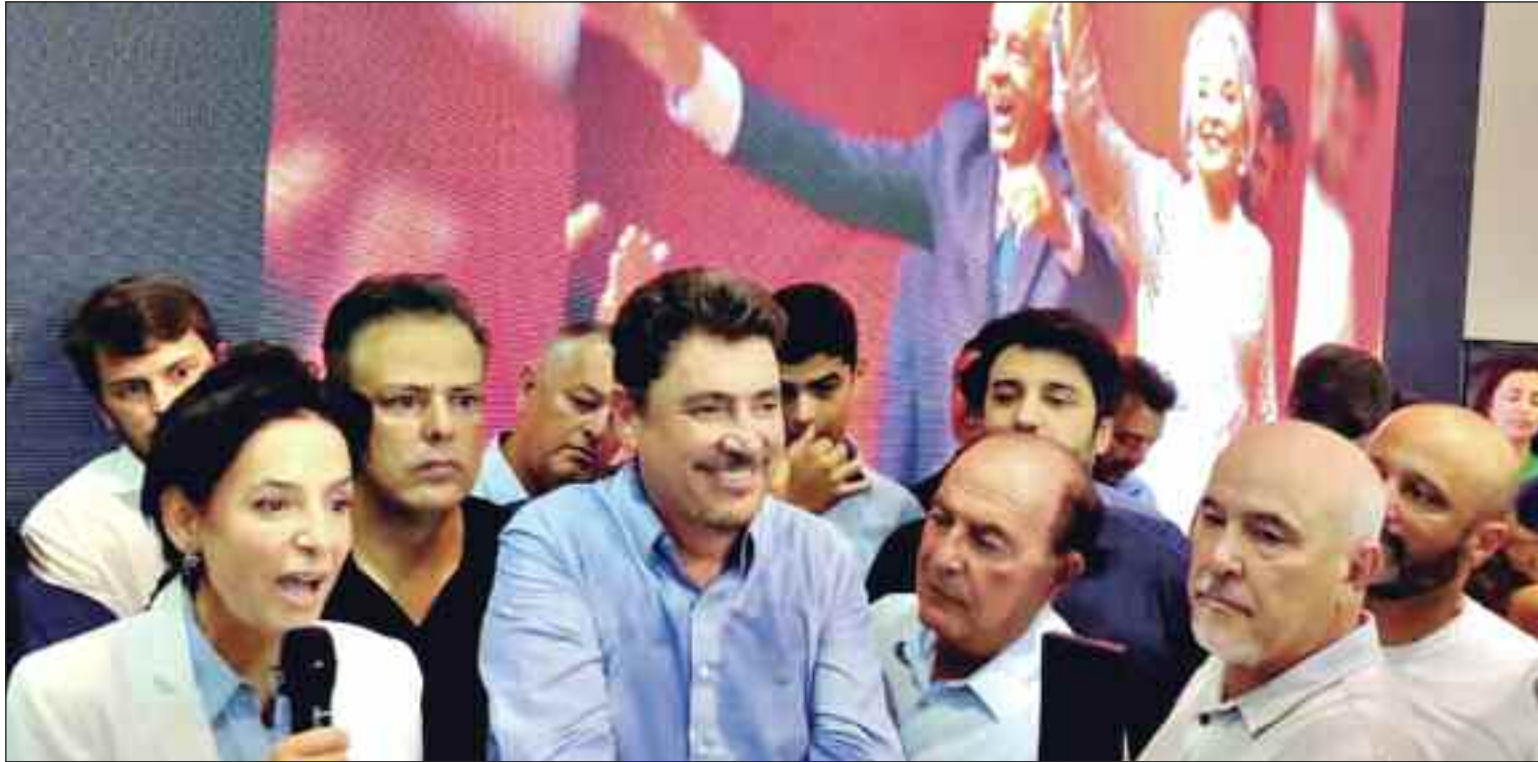
Filha de Iris Rezende, empresária leva capital simbólico para novo projeto político

Para o PL, a composição amplia a densidade política da pré-candidatura de Wilder Moraes e sinaliza alinhamento com a estratégia nacional da