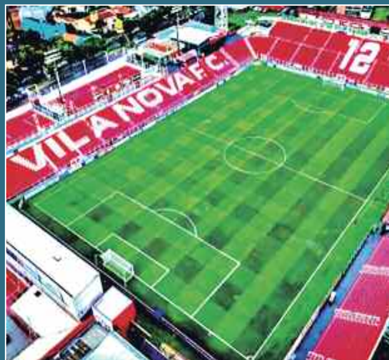
OBA com gramado novo