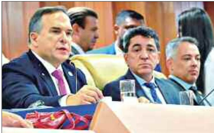
Mesmo com discurso de aproximação institucional, oposição mantém ofensiva política contra a gestão

tos, principalmente para o Legislativo”, disse.