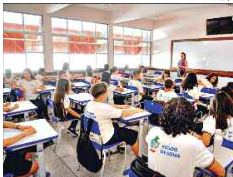
Novos professores vão integrar a rede estadual de ensino a partir do dia 3 de março

fessores nomeados e empossados, serão disponibilizadas quatro datas: 23, 24, 25 e 26 de fevereiro, das 9h às 12h e das 14h30 às 18h. Conforme cronograma já adotado em turmas anteriores, não será permitida a alteração do agendamento.