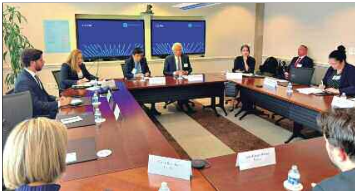
Antes da reunião com o vice-secretário de Estado americano, Christopher Landau, que ocorreu a portas fechadas, o governador Ronaldo Caiado participou de reunião na Câmara de Comércio dos Estados Unidos (U.S. Chamber of Commerce)

Encontro com vice-secretário de Estado americano, Christopher Landau, coloca potencial goiano no centro do debate