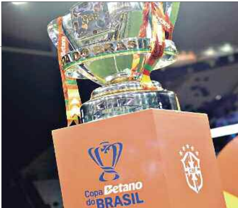
Copa do Brasil, a competição que distribui mais prêmios no Brasil

Grupo 2 e R$ 1,07 milhão para os clubes do Grupo 3. A partir da quinta fase, a premia-