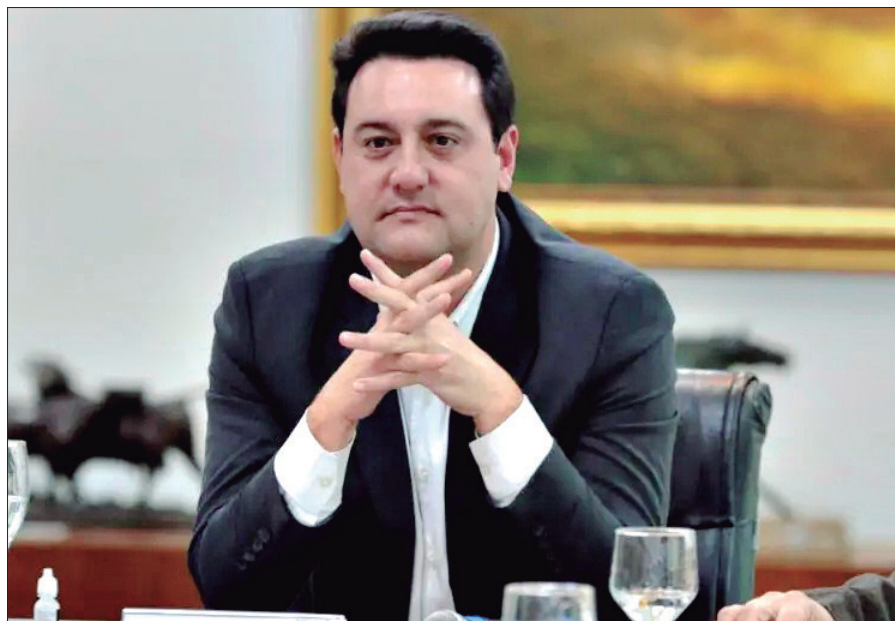
Geraldo Bubniak/Governo do Paraná