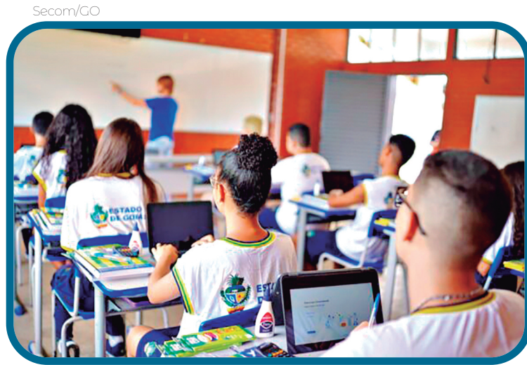
Mais de 84 mil estudantes da rede estadual de Goiás estudam em jornada superior a sete horas diárias, segundo o Censo Escolar 2025

O indicador também revela a abrangência da política educacional no estado. Segundo o levantamento, mais de 80% das escolas estaduais contam com estudantes matriculados em regime de educação integral. A oferta