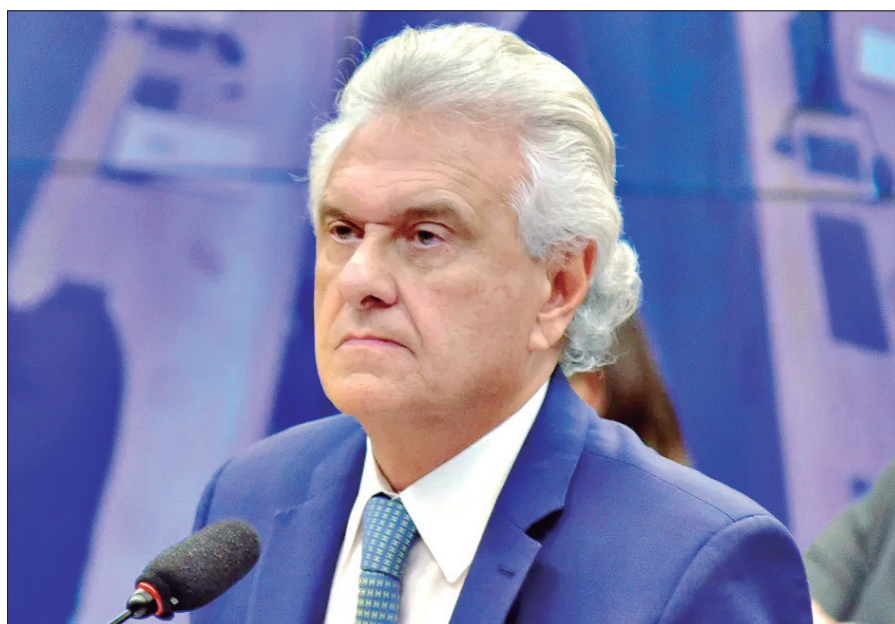
Câmara dos Deputados

pelo presidente nacional do PSD, Gilberto Kassab, que tem buscado construir uma candidatura de oposição ao governo federal, porém com discurso mais moderado. Antes de oficializar a decisão, no entanto, a direção do partido pretende ampliar as negociações com outras legendas, entre elas MDB e Republicanos, com o objetivo de formar uma aliança mais ampla. A estratégia do PSD é construir um campo de centro capaz de disputar espaço tanto com o presidente Luiz Inácio Lula da Silva quanto com o campo político ligado ao ex-presidente Jair Bolsonaro nas eleições de 2026.