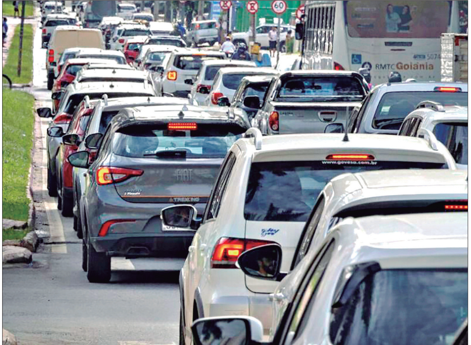
Débitos de IPVA também podem ser parcelados com descontos por meio do programa Negocie Já II

A Lei nº 24.107 foi sancionada pelo governador Ronaldo Caiado e publicada na segunda-feira (9/3) no Diário Oficial do Estado (DOE). Ela ampliou o alcance do programa Negocie Já II, em vigor desde 1º de fevereiro de 2026. Na semana anterior, o conselheiro Edson Ferrari aceitou os argumentos da denúncia protocolada pelo Sindicato dos Funcionários do Fisco do Estado de Goiás