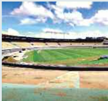
Goiás x Cruzeiro devem jogar no Serra Dourada

✓ O Goiás avança em seu objetivo de disputar o jogo contra o Cruzeiro no estádio Serra Dourada. O gramado está sendo preparado por técnicos do próprio Goiás e a documentação exigida pela CBF está sendo providenciada.