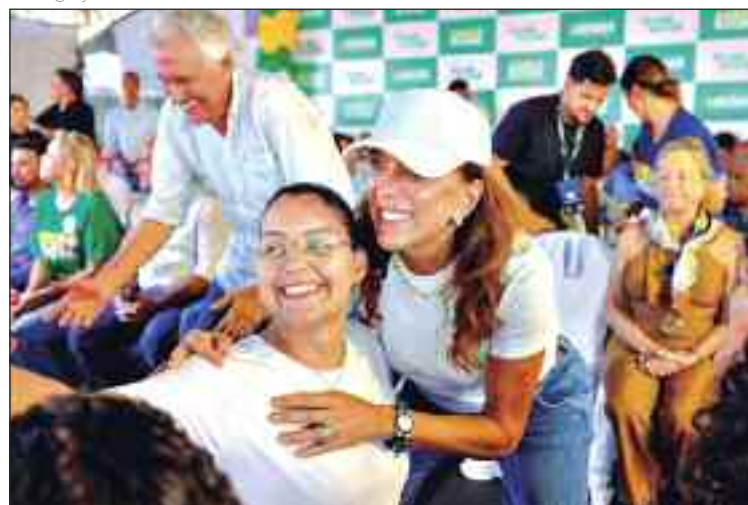
Gracinha Caiado lidera corrida ao Senado, revela pesquisa

Oséias Varão, também do PL, é lembrado por 2,1%. O advogado Iure Castro (Novo) tem 1,9%. Os indecisos são 7,6%; brancos e nulos, 9,5%.