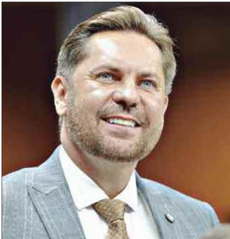
Presidentes da Câmara e da Alego ampliam estrutura, fortalecem base política e alçam novos voos