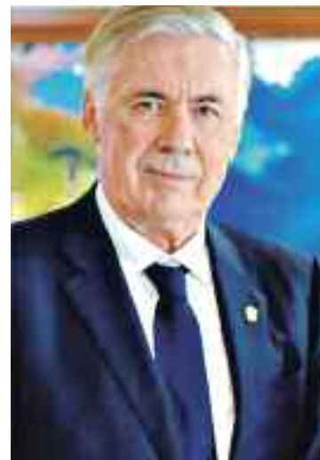
Carlo Ancelotti, um italiano no comando da seleção brasileira