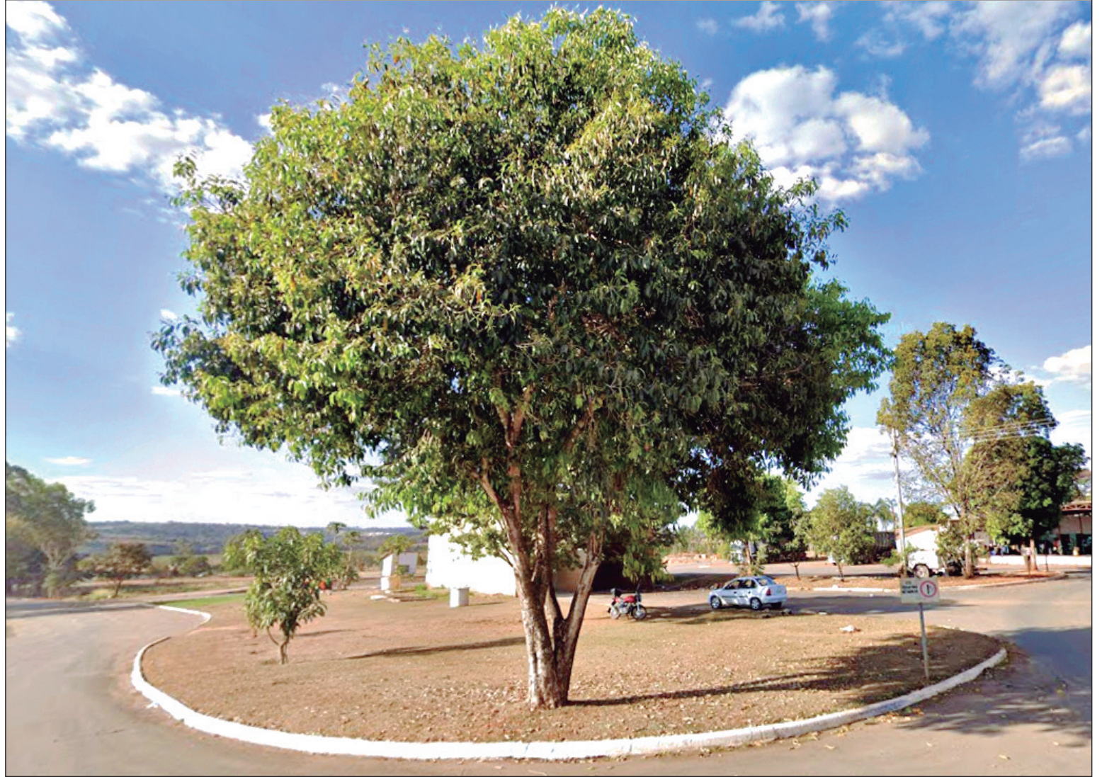
Levantamento técnico busca atribuir valor de mercado a terreno de 48 hectares

Todo o processo administrativo que embasou a contratação tramitou sob acesso restrito no sistema da Prefeitura de Goiânia