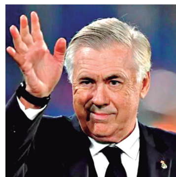
Carlo Ancelotti, contrato até 2030 com a CBF

salário astronômico para um técnico fazer uma seleção de um país ser campeão mundial. O Brasil já venceu a Copa do Mundo em cinco oportunidades e em nenhuma delas ninguém ganhou tanto dinheiro. Mas tínhamos melhores jogadores, atletas que honravam a nossa seleção. Atualmente, eles não se interessam mais em vestir a camisa verde e amarela. Recebem uma convocação ainda muito jovem, mas já milionários, portanto, desmotivados para jogar uma Copa do Mundo, principalmente porque sabem que nossa seleção não impacta mais o planeta, como o fez no passado.