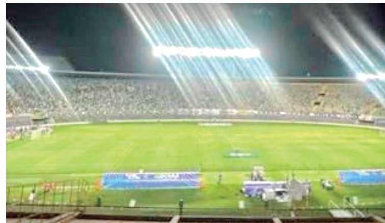
Goiás x Cruzeiro confirmado para o estádio Serra Dourada.