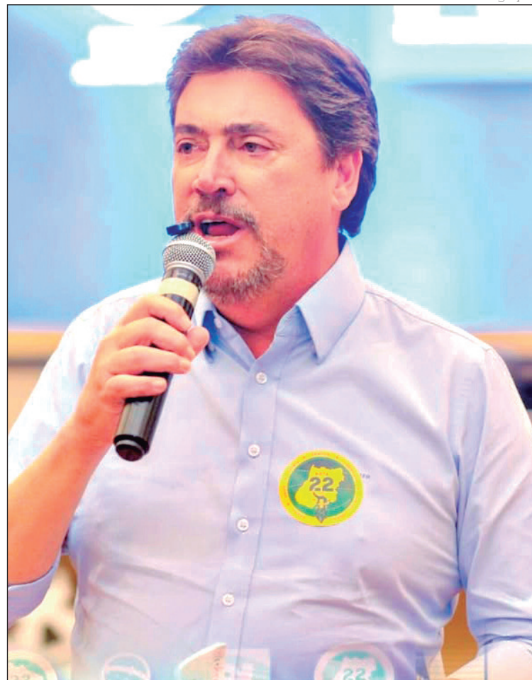
Movimentações de Wilder e Marconi expõem leituras diferentes sobre o eleitorado goiano

ta do interior. A estratégia do senador passa justamente por ocupar esse espaço antes que sejam cooptados para outro projeto.