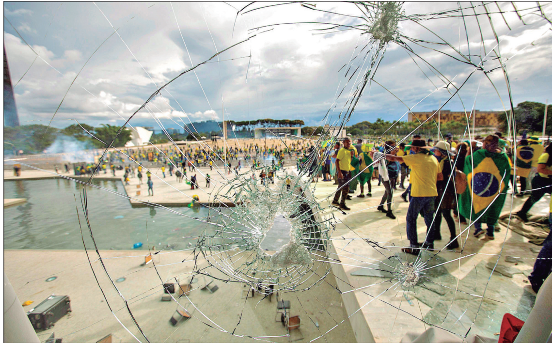
A nova forma de soma de penas deve beneficiar todos os condenados pelo STF pelos crimes de 8 de janeiro

Redução de pena de condenados não é automática e pedidos deverão ser analisados individualmente pelo STF