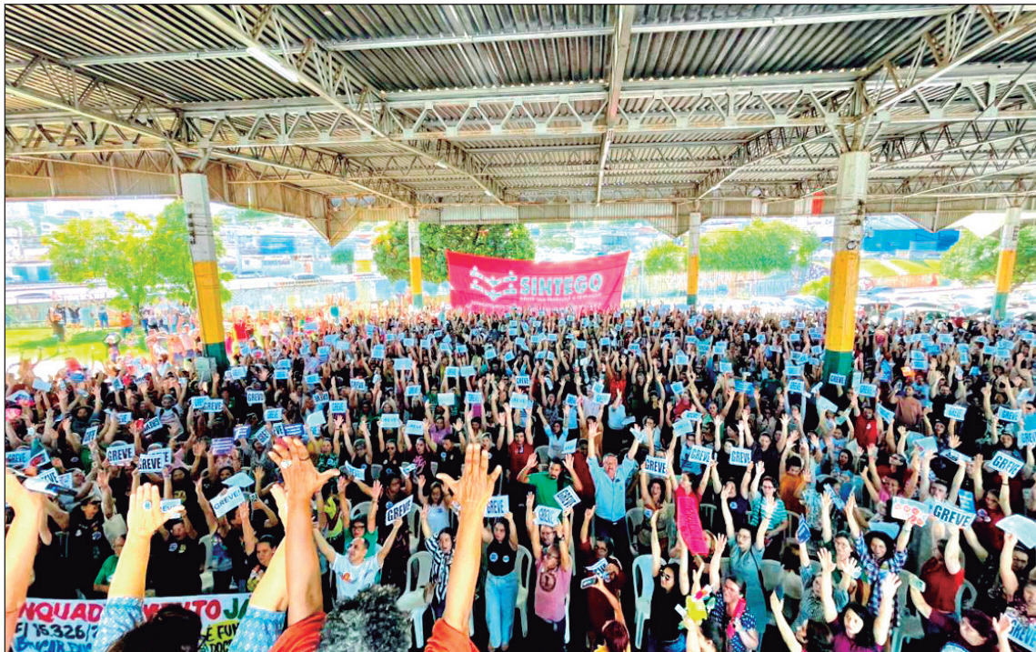
Mobilização da Educação municipal ganha força em Goiânia com aprovação de greve pelos servidores

Paralisação começa no dia 12 e reúne reivindicações salariais, cobrança por melhores condições de trabalho e críticas à possível terceirização da merenda escolar