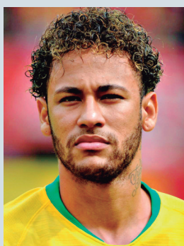
Neymar, fase ruim e indisciplina. Não deve ser convocado