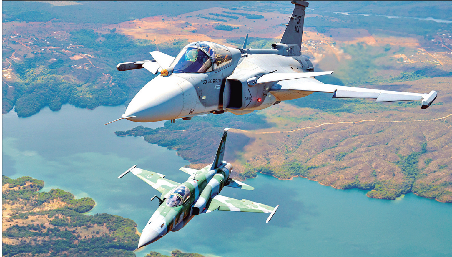
Atualmente, o Gripen E é operado pelo 1º Grupo de Defesa Aérea, na BAAN

ções reais de conflito ou crise. Durante quase três semanas, serão executadas missões que envolvem apoio aéreo aproximado, ataques estratégicos, defesa antiaérea, evacuação aeromédica, transporte logístico, infiltração de tropas e ações de reconhecimento.