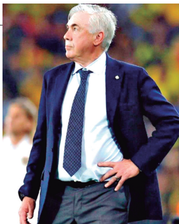
Carlo Ancelotti, dúvidas na convocação final

A seleção brasileira enfrenta baixas significativas para a Copa do Mundo de 2026, em função de lesões graves na reta final da temporada, com destaque para o atacante Rodrygo, do Real Madrid, que sofreu ruptura de ligamento e menisco, Vander-son, do Mônaco, Raphinha, do Barcelona, fora depois de ter