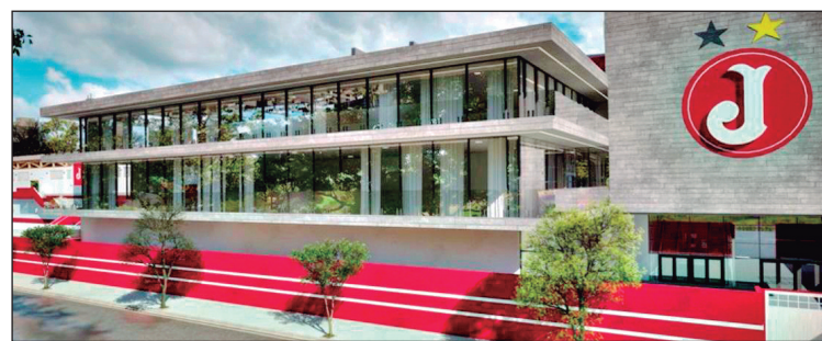
Fachada principal do novo estádio do Juventus na Mooca

As ruas do bairro da Mooca foram tomadas pelos torcedores do Juventus logo após a confirmação do acesso do "Moleque Travesso". Um "carnaval temporário" foi o que se viu no bairro formado por italianos na capital paulista, torcedores apaixonados pelo mais tradicional time de São Paulo. Dizem os his-