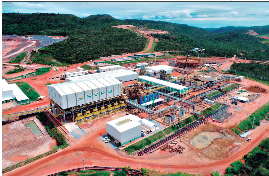
Goiás lidera produção de terras raras, mas o mineral ainda representa menos de 1% da arrecadação

A participação reduzida se mantém mesmo após o início da produção comercial, em 2024, quando as terras raras representaram 1,61% da arrecadação, com cerca de R$ 2,9 milhões. Em