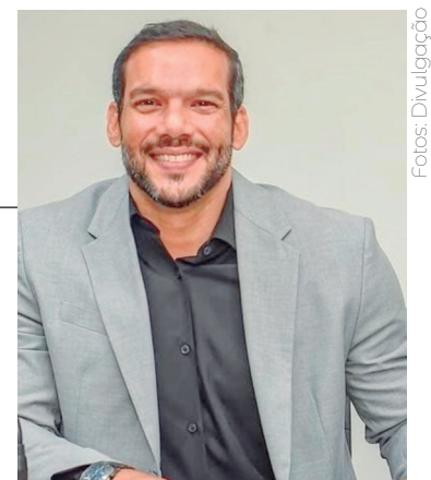
Samuel Xaud, presidente da CBF: maior premiação da história das Copas

O grupo já estava na Itália, durante o Mundial e ainda tinha discussão sobre premiação. Os jogadores chegaram até a colocar na roda de discussão o dinheiro que Lazaroni estava ganhando da Fiat em comerciais lançados por ocasião da Copa. Naquela época, uns entendiam que a premiação deveria ser dividida só entre os jogadores. A Comissão Técnica não gostou, e com razão. "Em 1994, ficou