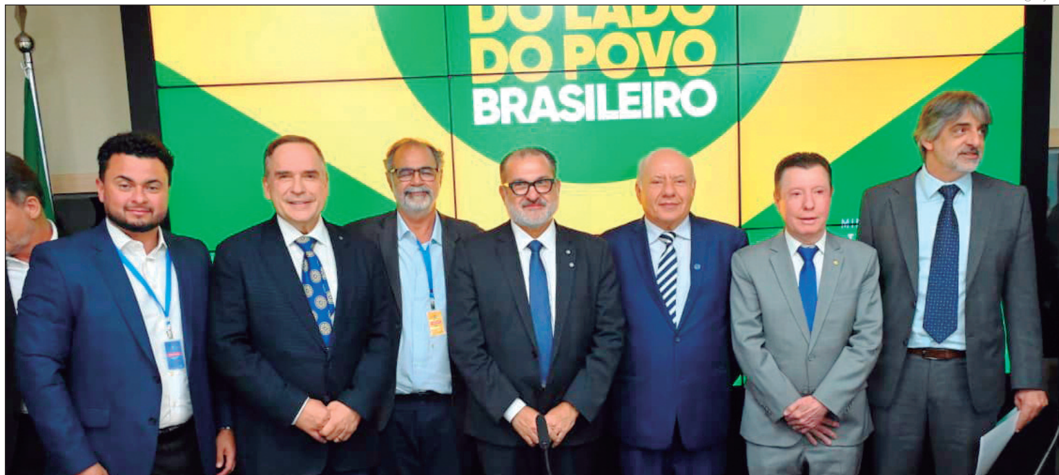
Em poucos dias, Goiânia garantiu recursos para Saúde e viu avançar a licitação do anel viário de R$ 1,1 bilhão

Na saúde, a Prefeitura recebeu recursos para retomada de obras em seis unidades básicas de saúde, autorizou a construção da UBS Grajaú com recursos do PAC Saúde e garantiu a chegada de duas carretas oftalmológicas do programa Agora Tem Especialistas, do Ministério da Saúde. As unidades móveis permanecerão 45 dias na