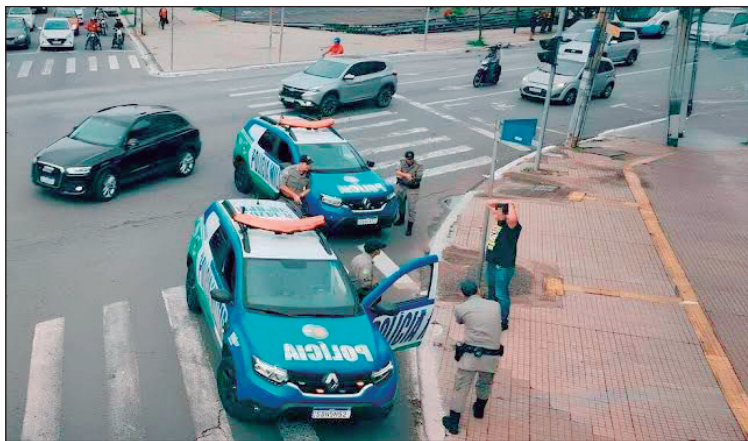
Uso de tecnologia de ponta aumenta efetividade das forças policiais em Goiás