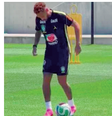
Neymar volta aos treinos, mas não tem condições físicas para jogar

Ao contrário da Argentina, Portugal não fez boa estreia na Copa. Empatou com a República do Congo em 1 a 1 e Cristiano Ronaldo não foi bem nesta partida. Mas ostenta forma física exemplar, condicionamento técnico e tático sem reparos. O Português da Ilha da Madeira sempre idolatrou seu próprio corpo. Se cuidou para a prática do futebol, por isso, ainda joga com a disposição de um jovem. Neymar não precisaria idolatrar seu próprio corpo, como o faz Cristiano