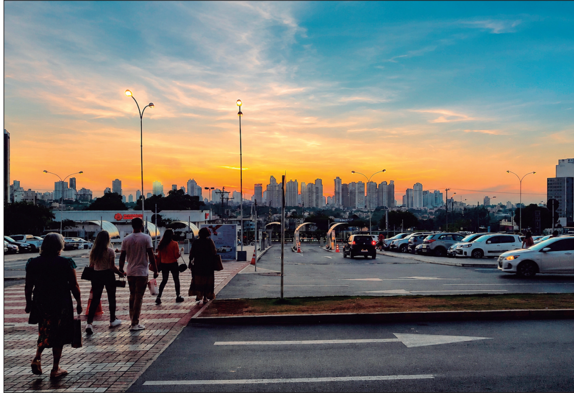
A Região Metropolitana de Goiânia aparece entre as capitais com os menores percentuais de pessoas na extrema pobreza

Levantamento aponta que apenas 1,5% da população da região metropolitana vive em extrema pobreza; contraste com outras capitais expõe diferenças no desenvolvimento urbano brasileiro