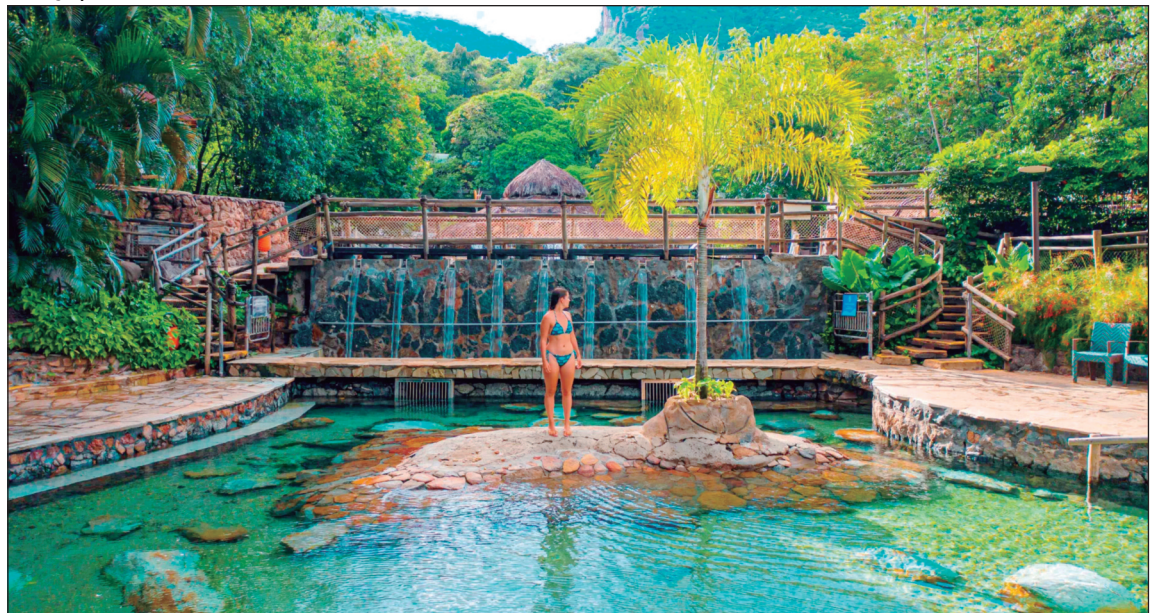
Um dos clubes de águas termais na cidade de Rio Quente

ga de moradias populares, o fortalecimento das ações do CRAS e programas de capacitação profissional ajudaram a ampliar a inclusão social e as oportunidades de geração de renda.