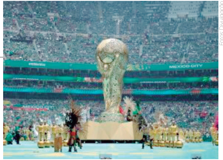
Cerimonia de abertura da Copa não agradou