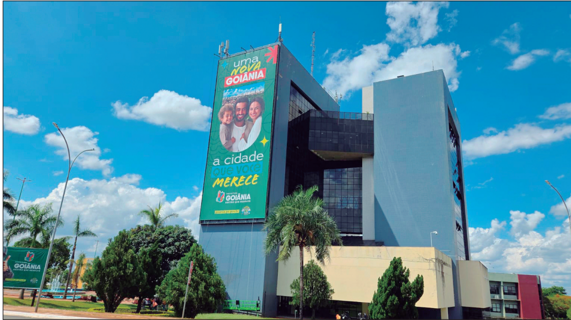
Paço atribui necessidade de contratos temporários ao volume de ausências na rede

Números foram apresentados ao TCM durante julgamento sobre convocação de concursados e surgem um ano após a adoção do pente-fino em licenças médicas