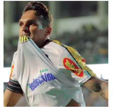
Novorizontino atropela o Goiás. Recado contra atrasos nos salários?